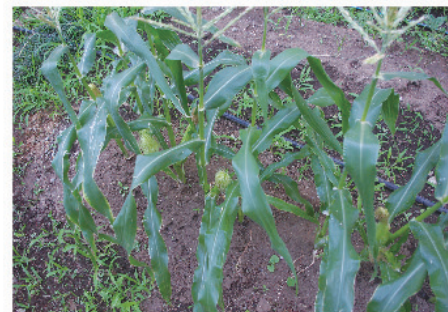
夏場にすくすくと育つトウモロコシ。