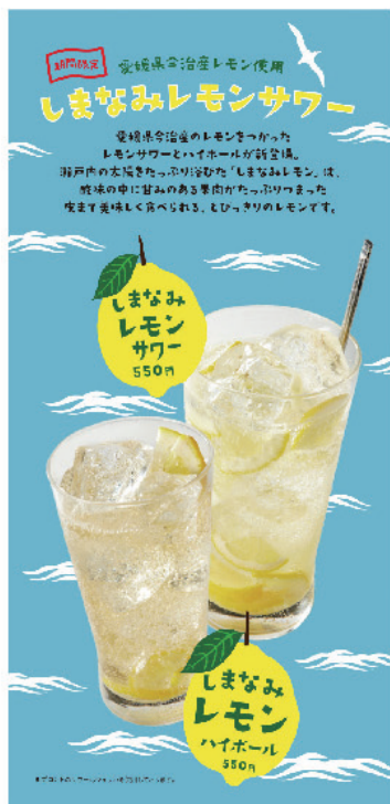
フロントで紹介されている告知物。