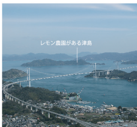
自然に恵まれた瀬戸内(愛媛県今治市)の島々。

しまなみレモンがカフェ&バー 「プロント」で商品化されました。 愛媛県今治産レモンに こだわったドリンクメニュー。 都内を中心に全国で294店舗(平成28年3月)を展開するカフェ&バーの大手「プロント」にて、組合員の(有)しまなみ王国が管理する津島の農園で獲れた「しまなみレモン」を使ったドリンクメニューが期間限定で提供されました。 国産で減農薬、無農薬というこだわりのレモンを求めているプロントと、自然豊かな瀬戸内の津