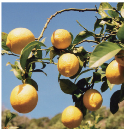
実際のしまなみレモン果実。(津島のレモン農園)

しまなみレモンがカフェ&バー 「プロント」で商品化されました。 愛媛県今治産レモンに こだわったドリンクメニュー。 都内を中心に全国で294店舗(平成28年3月)を展開するカフェ&バーの大手「プロント」にて、組合員の(有)しまなみ王国が管理する津島の農園で獲れた「しまなみレモン」を使ったドリンクメニューが期間限定で提供されました。 国産で減農薬、無農薬というこだわりのレモンを求めているプロントと、自然豊かな瀬戸内の津