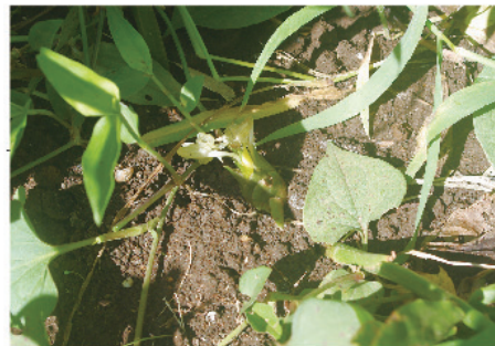
初めて挑戦した早稲田ミョウガも立派に育ちました。(写真中央)

庶民に大変好まれていますが、明治以降に宅地化が進み減少の一途をたどり姿を消しましたが、地域の研究会や捜索隊の努力で2011年に見事復活しました。 そんな貴重な早稲田ミョウガを戸塚地区協議会のご協力で昨年初めて栽培しました。数は少ななくても見事に育ちました。今年の収穫は果たして？