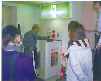
消火栓の使い方をレクチャー。