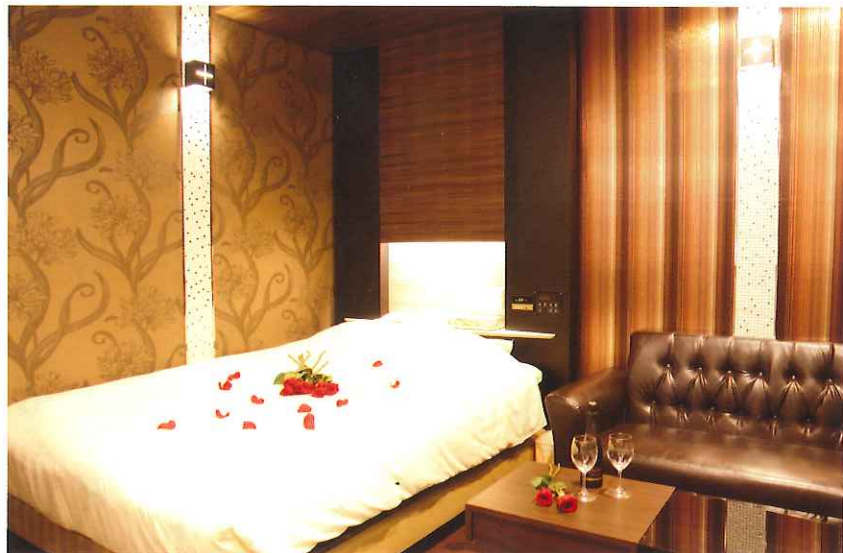
ゴージャスな空間を味わえる308号室。

北陸新幹線の開通を控えて、ますますビッグターミナルとなるJR大宮駅。その東口から徒歩3分にあるホテルレッツは、フランス風プチホテルを意識したオシャレな外観に、内装もよりゴージャス。今も進化を続けています。新都心エリアの大宮では圧倒的な人気を誇ります。