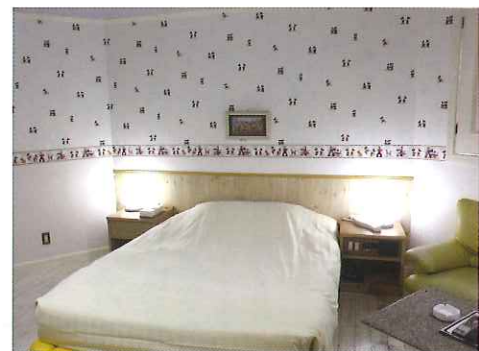
ディズニーキャラクターがいっぱいの201号室。

また、可愛らしさが全面に演出されディズニーキャラクターがお迎えする部屋は、女性客に大好評。人気が高い部屋でもあり、宿泊の場合は事前に予約される事をおすすめします。各部屋の設備やアメニティも充実しており詳しくはホームページを是非ご覧ください。