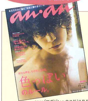
anan(マガジンハウス社)1月号。