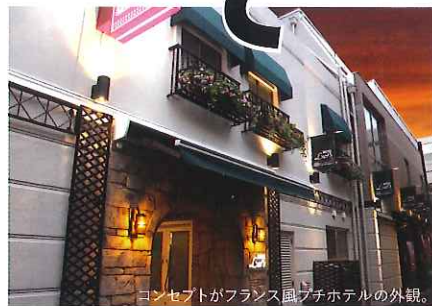
コンセプトがフランス風プチホテルの外観。

また、可愛らしさが全面に演出されディズニーキャラクターがお迎えする部屋は、女性客に大好評。人気が高い部屋でもあり、宿泊の場合は事前に予約される事をおすすめします。各部屋の設備やアメニティも充実しており詳しくはホームページを是非ご覧ください。