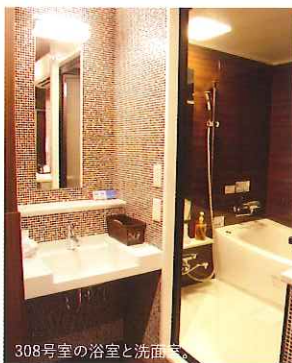
308号室の浴室と洗面台