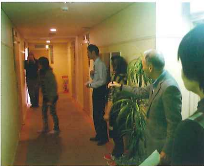
客室から避難誘導の手順をレクチャー。

など、シミュレーションを兼ねた訓練で職員には常に安心・安全を心がけるように指導されています。