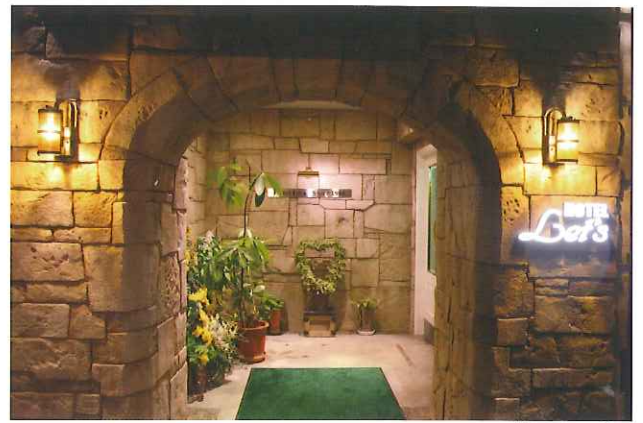
ホテルレッツ入口

ホテルレッツの職員は定期的に消防訓練を受けています。またレッツビルの耐震補強も既に施工済みで、ご利用されるお客様の安全のために万全を期しています。